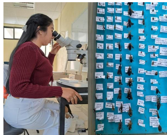
Figura 3. Determinación taxonómica de los insectos.

Determinación taxonómica: Para la identificación a nivel familia y subfamilia se utilizarán claves taxonómicas [8] (Figura 3). Por lo anterior, se obtuvo un listado de la fauna entomológica asociada al cultivo del nopal verdura en el área experimental de la Unidad Académica de Metztitlán.