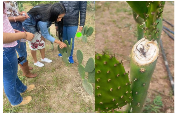
Figura 2. Trabajo de campo. Colecta directa de insectos.

La captura de insectos principalmente adultos se realizó mediante colectas directas utilizando pinzas y redes entomológicas durante una hora cada día. Posteriormente se depositaron en frascos con alcohol etílico al 70 % previamente etiquetados con la fecha de colecta (Figura 2).